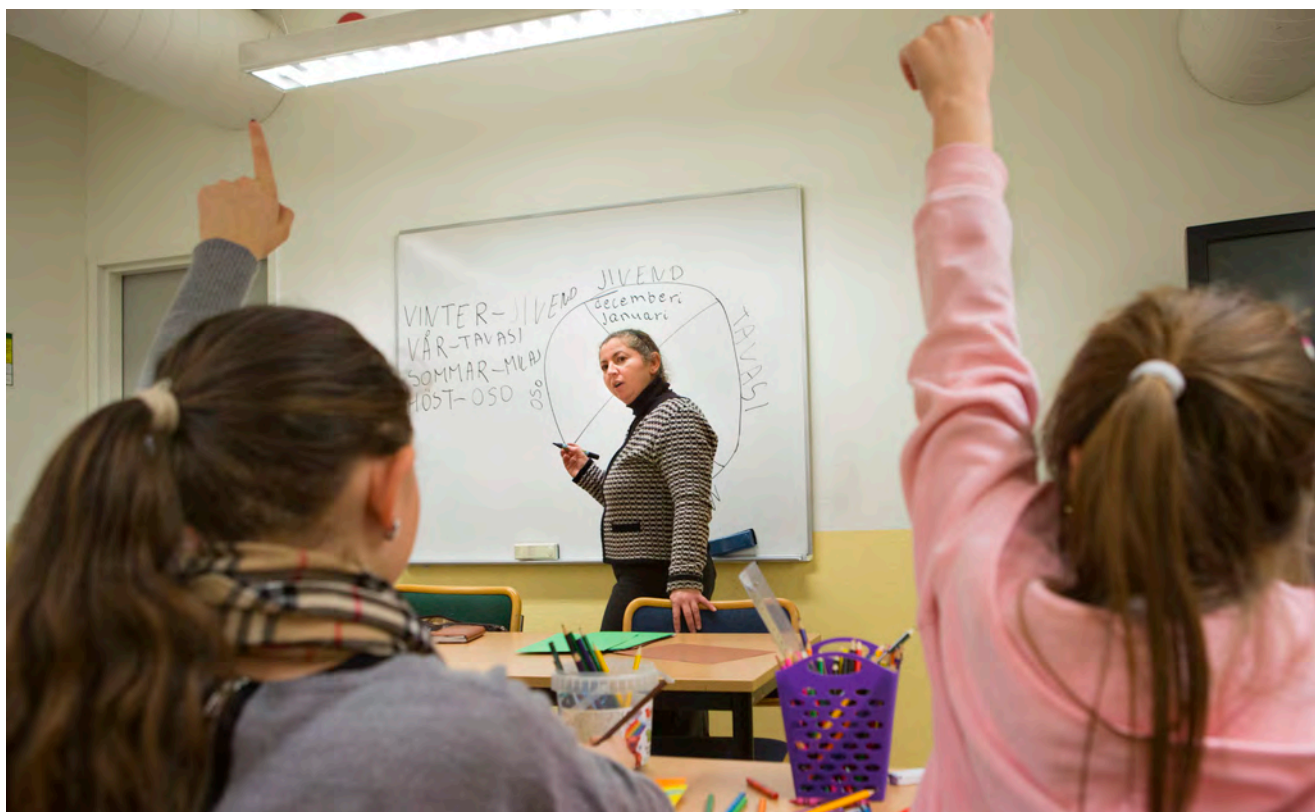
Modersmålsundervisning i romska pågår.

Vill man läsa romska på universitetet är det svårt idag. Södertörns högskola utanför Stockholm har ansvar för romskan, men har nästan inga kurser i språket. De har ibland andra utbildningar som kallas för romska studier.