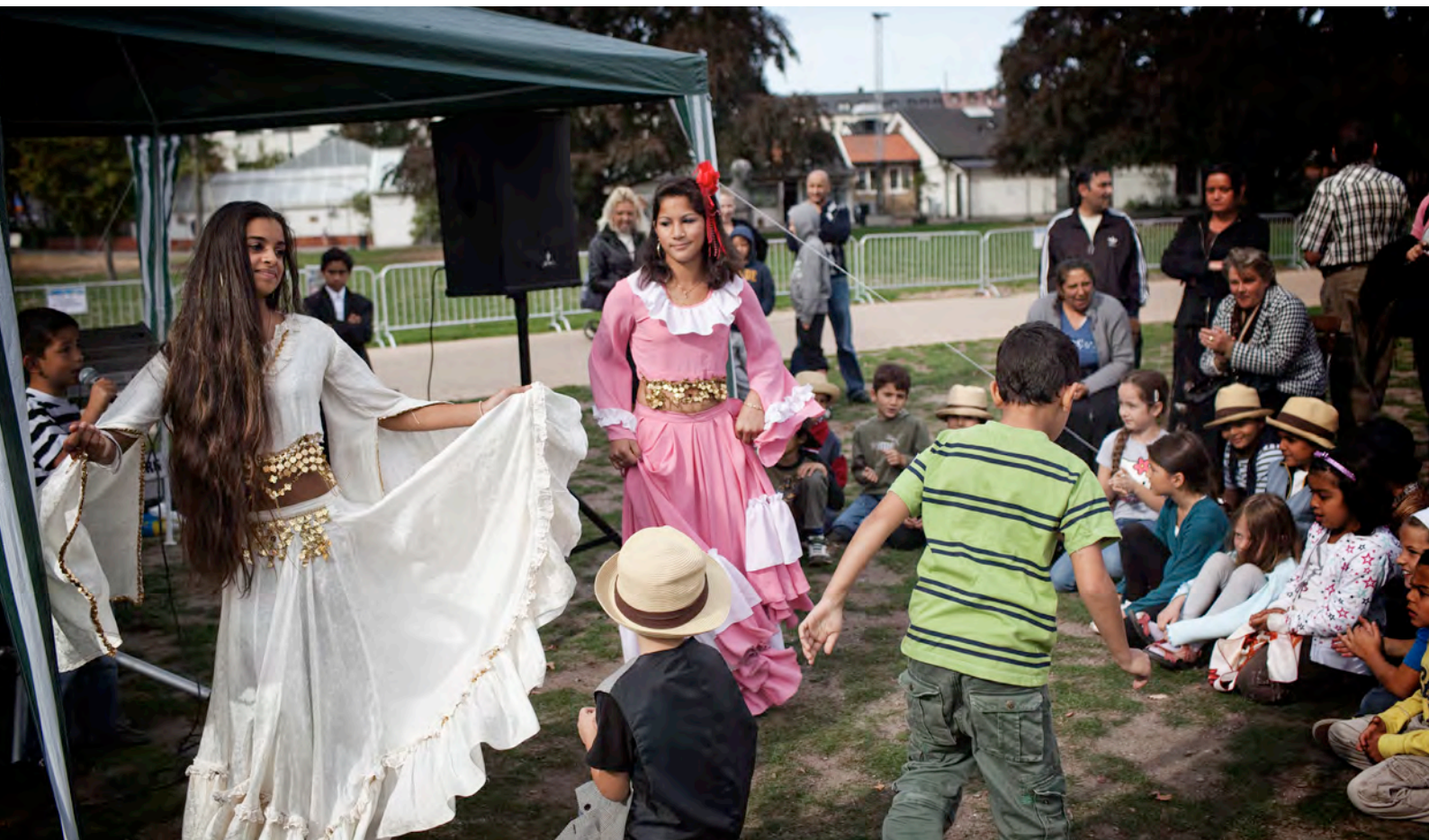
I Malmö Folkets park firas romsk kulturvecka med dans, sång och matlagning.

Den romska kulturen har överlevt alla förföljelser och all diskriminering. Romerna har i århundraden arbetat med hantverk av olika slag. De har blivit kända för sitt fina handarbete inom till exempel smide, träsnidande och korgbindning. Romerna var också ett skickligt handelsfolk och reste runt i världen för att söka nya varor till försäljning.