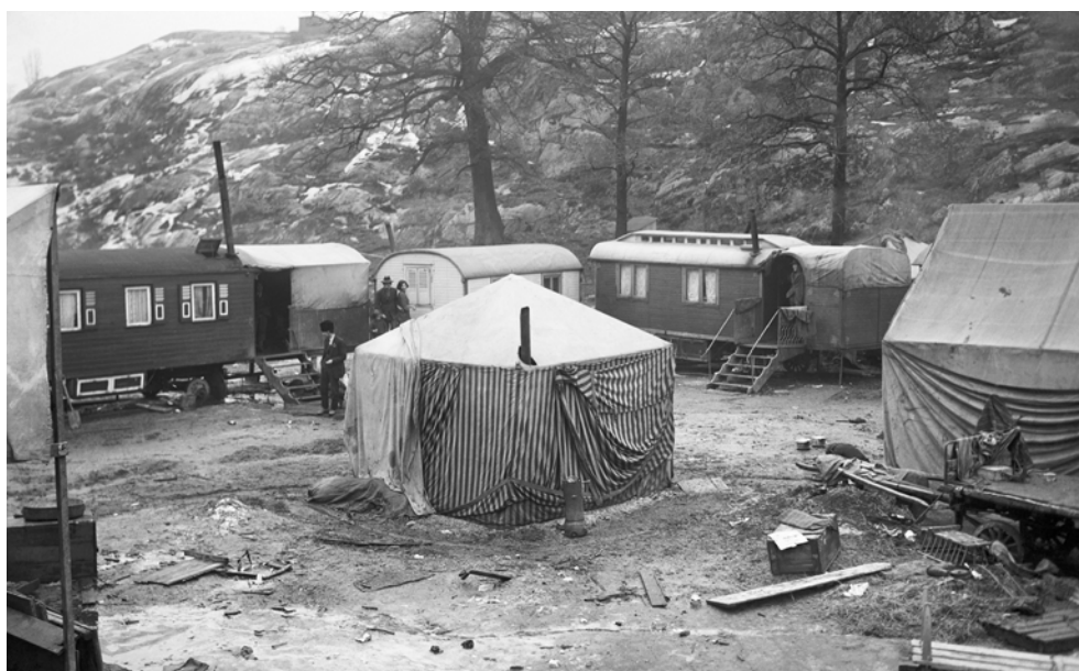
Foto från ett romskt läger i Gröndal, Stockholm, 1927.

I början av 1950-talet höjdes många röster i Sverige för att man måste förbättra romernas levnadsvillkor. 1954 bestämdes det att det skulle ordnas bostäder åt romerna och 1959 att romska barn skulle få gå i skolan. Då fick romer även rösträtt i Sverige.